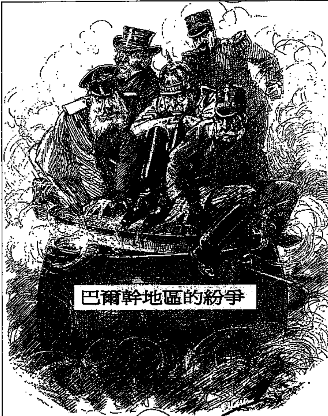
巴爾幹地區的紛爭