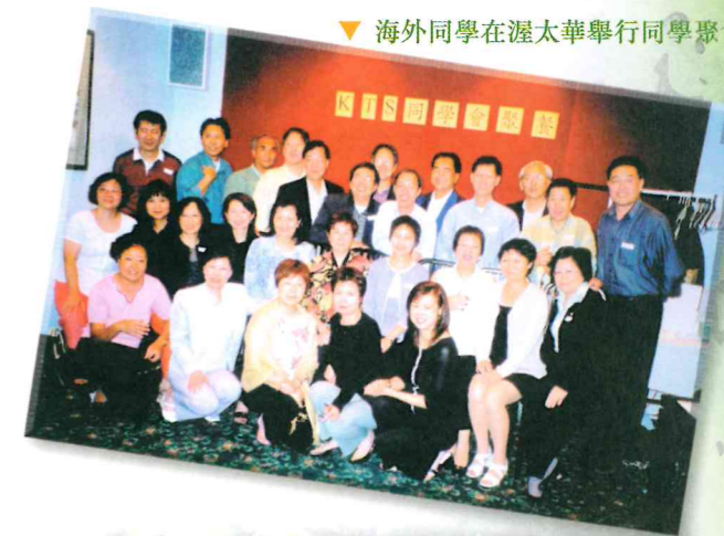
▼ 海外同學在渥太華舉行同學聚會