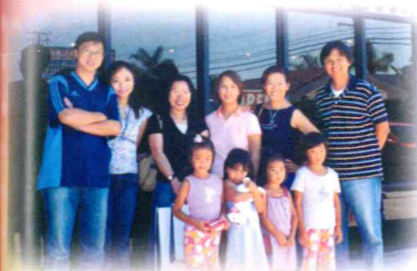
▲ 與美國校友聚舊,他們都關心學校的近況。