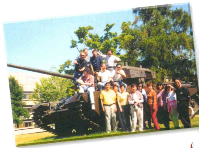
▲▲ 遊歷千島湖，既可欣賞風景，又可暢聚一番