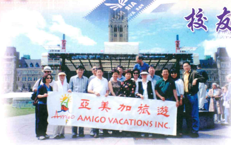
▲ 大家一起到美加旅遊