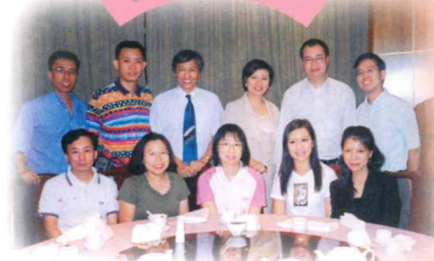
▲ 感謝各位校友支持學校的發展。