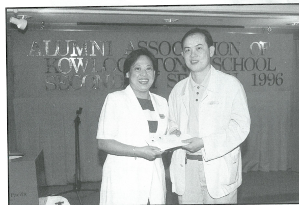
家教會主席在校友會週年大會上頒贈禮物