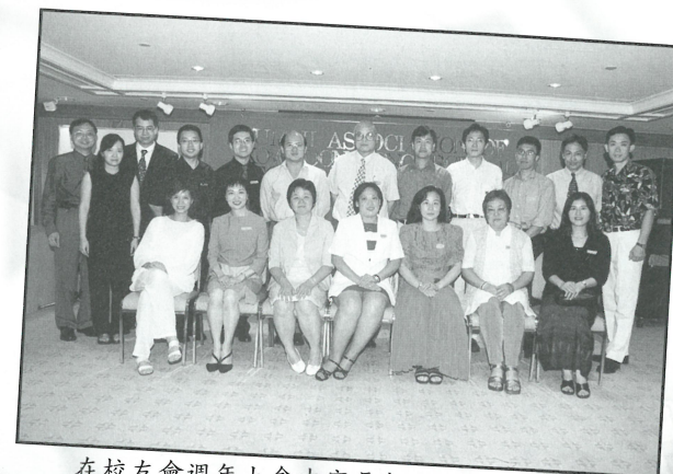
在校友會週年大會中家長教師會執委會到賀