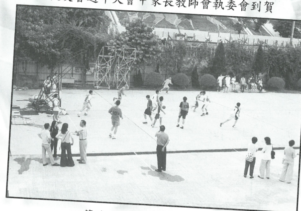
籃球友誼賽校友隊對校隊