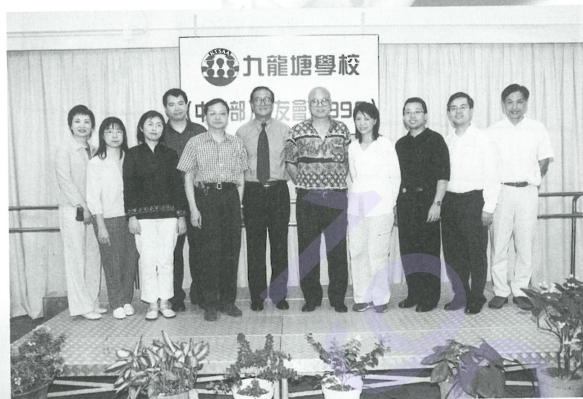
二〇〇〇至二〇〇一年度校友會執委會

回想九八年六月廿八日，於母校舉行之第三屆周年會員大會中選出了第二屆執委會成員，繼續為母校、各位校友及師弟師妹努力工作，務求將會務辦得更好，精益求精。轉瞬間第二屆執委會的任期又行將