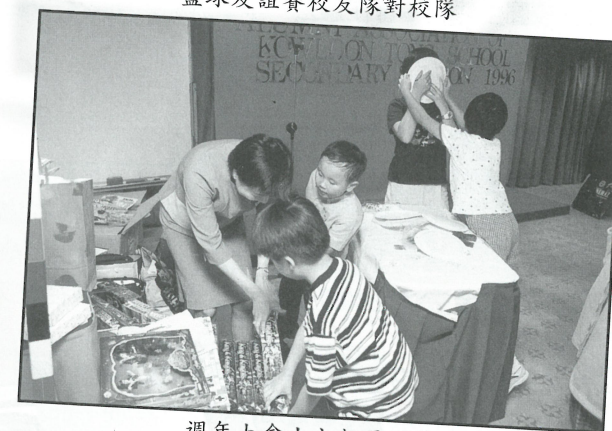
週年大會上之親子遊戲