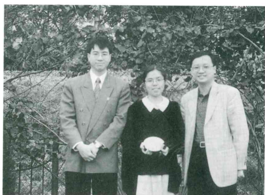
校友會會徽設計比賽得獎者