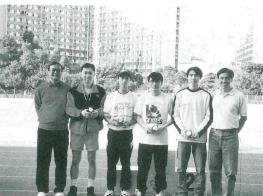
校友隊於陸運會勇奪挑戰盾