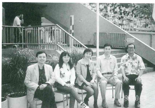
校友會執委出席水運會