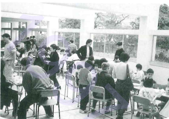
校友會舉辦之新春午宴