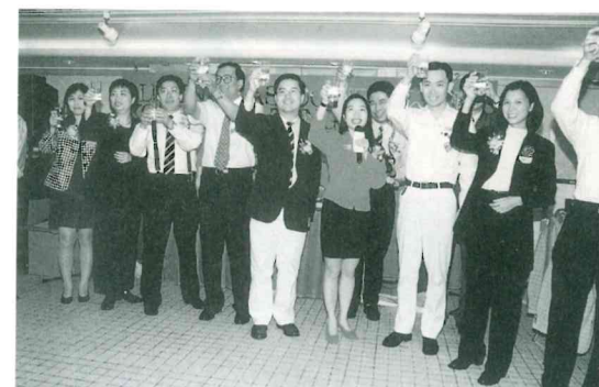
校友會執委會祝酒