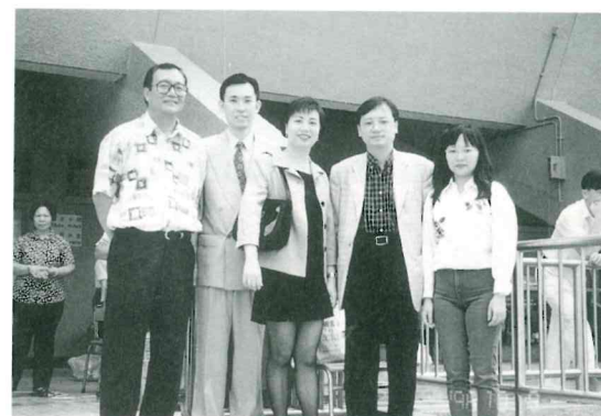
校友會執委出席水運會