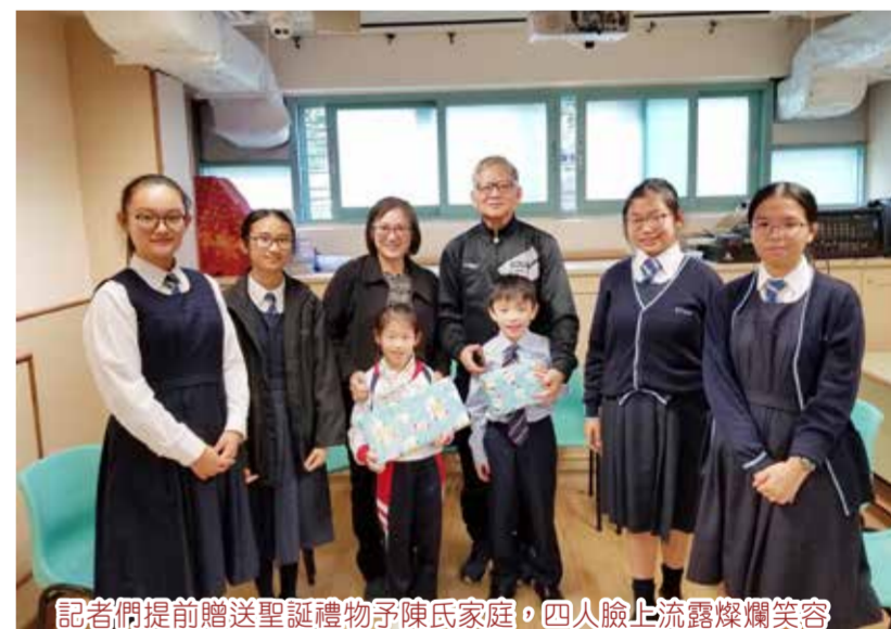
記者們提前贈送聖誕禮物予陳氏家庭，四人臉上流露燦爛笑容