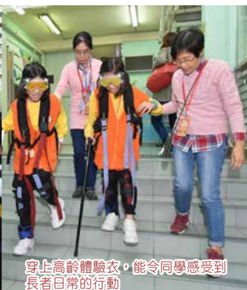
穿上高齡體驗衣，能令同學感受到長者日常的行動