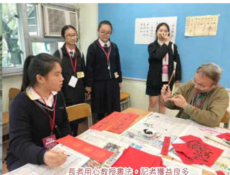
長者用心教授書法，記者獲益良多