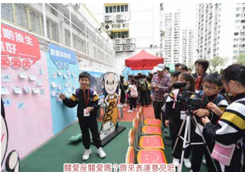
關愛座關愛嗎？齊來表達意見吧！